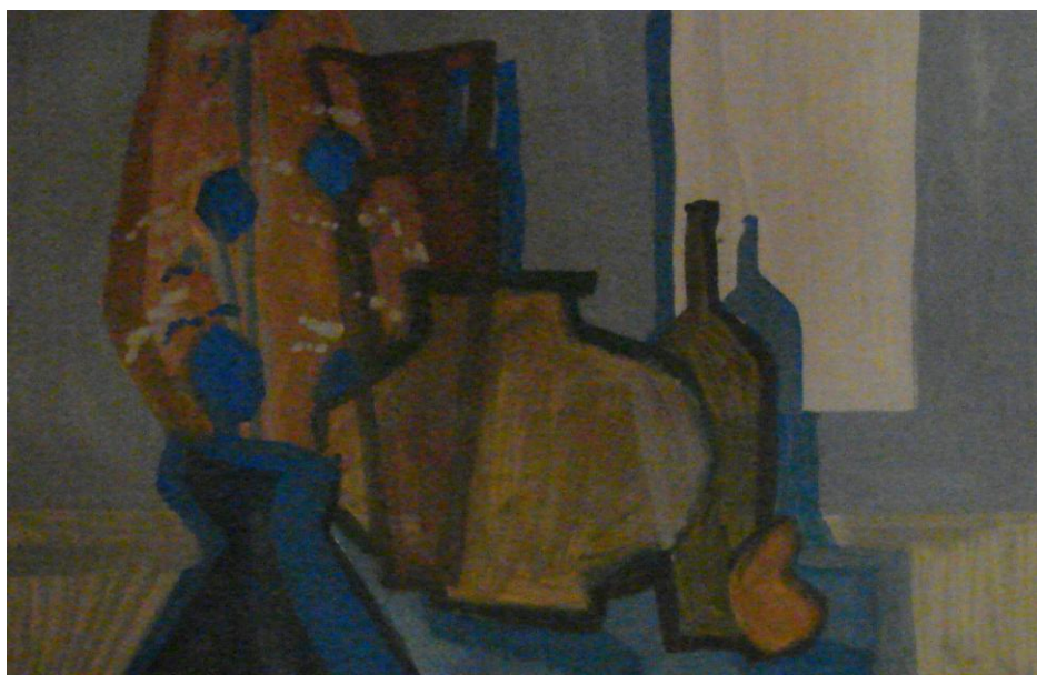
Рис 2 Окончательный вариант композиции