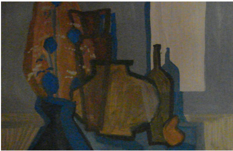
Рис 2 Окончательный вариант композиции

Заведующий кафедрой архитектуры, дизайна и декоративного искусства